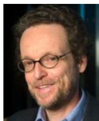
トマス・ポッジ 政治哲学 イェール大学 アメリカ