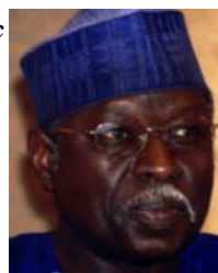
アダマ・サマッセコウ 言語学 CIPSH会長 元マリ教育相 マリ